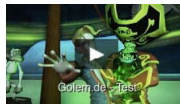
Tales of Monkey Island - Test von Launch of the Screaming Narwhal